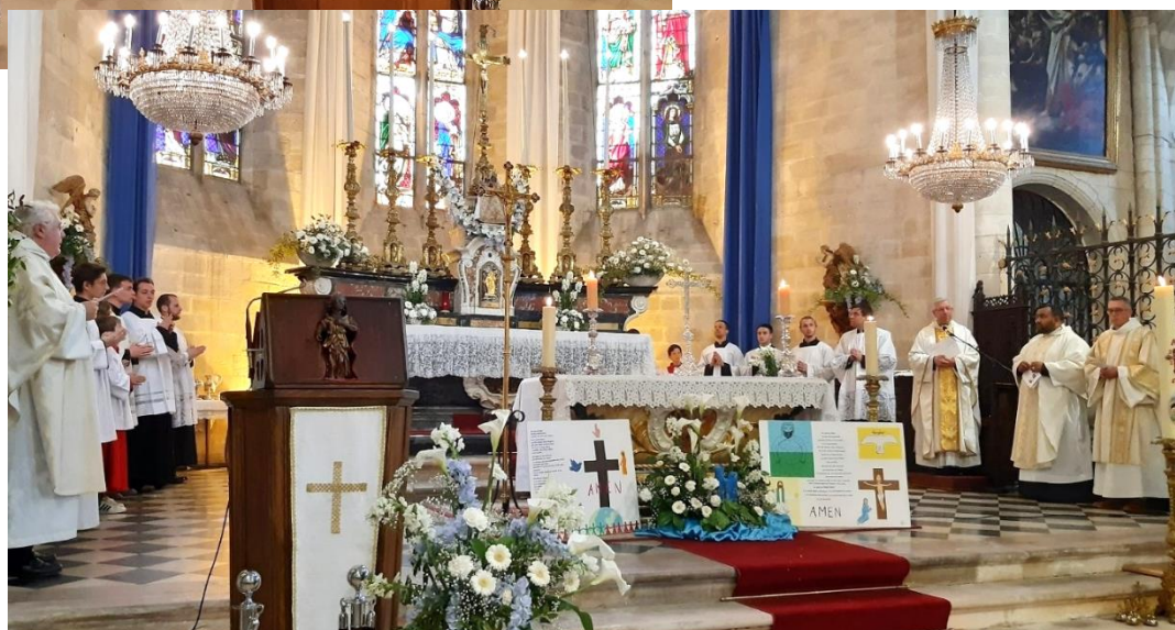
Célébration eucharistique de la solennité de l'Ascension