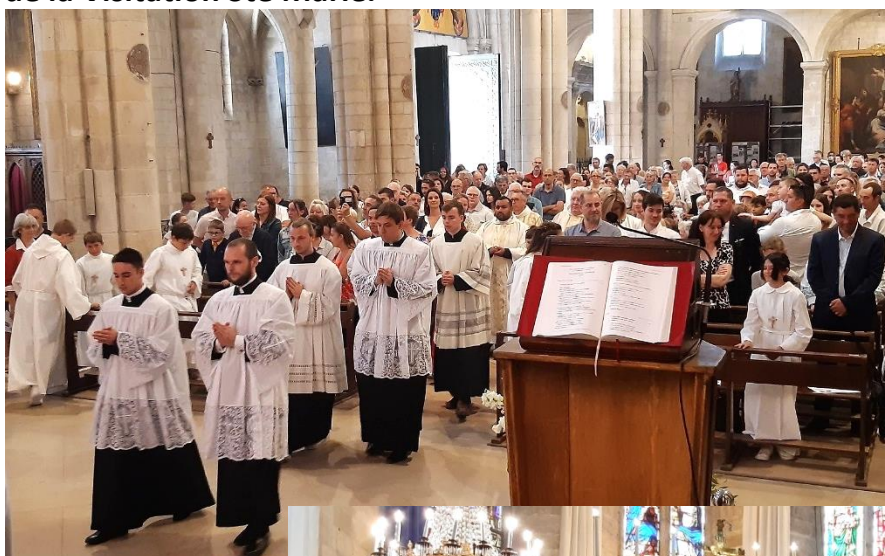
Procession d'entrée dans la collégiale Sainte Marthe

Suivies de la procession avec Notre-Dame du château de la collégiale Ste Marthe au Monastère de la Visitation Ste Marie.